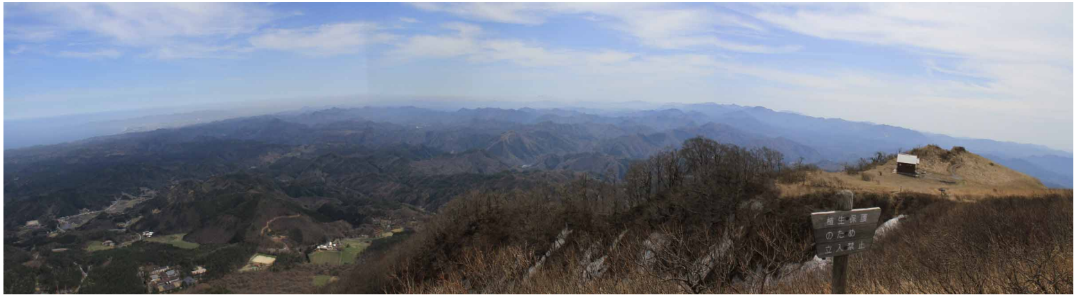
▲ 三瓶山山頂からのパノラマ